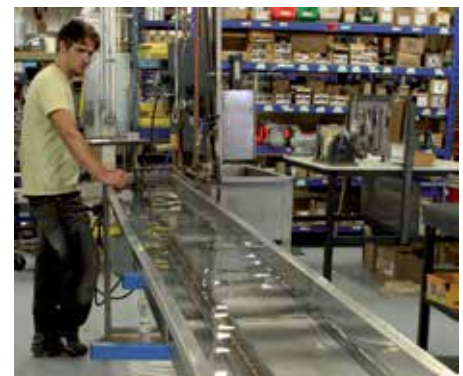
Eine der Teststationen in Eden Prairie