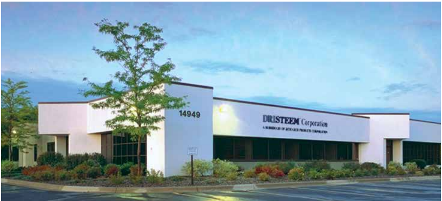
Produktions- und Verwaltungsgebäude von DriSteem in Eden Prairie

Schon seit 1995 arbeitet Kaut mit dem amerikanischen Hersteller DriSteem zusammen. Was mit einer Partnerschaft im Kleinen begann, da zuerst nur Einzel- und Mehrrohrdampfverteilssysteme importiert wurden, hat sich in fast 20 Jahren zu einer starken Geschäftsbeziehung entwickelt. Grund genug DriSteem einmal vorzustellen: